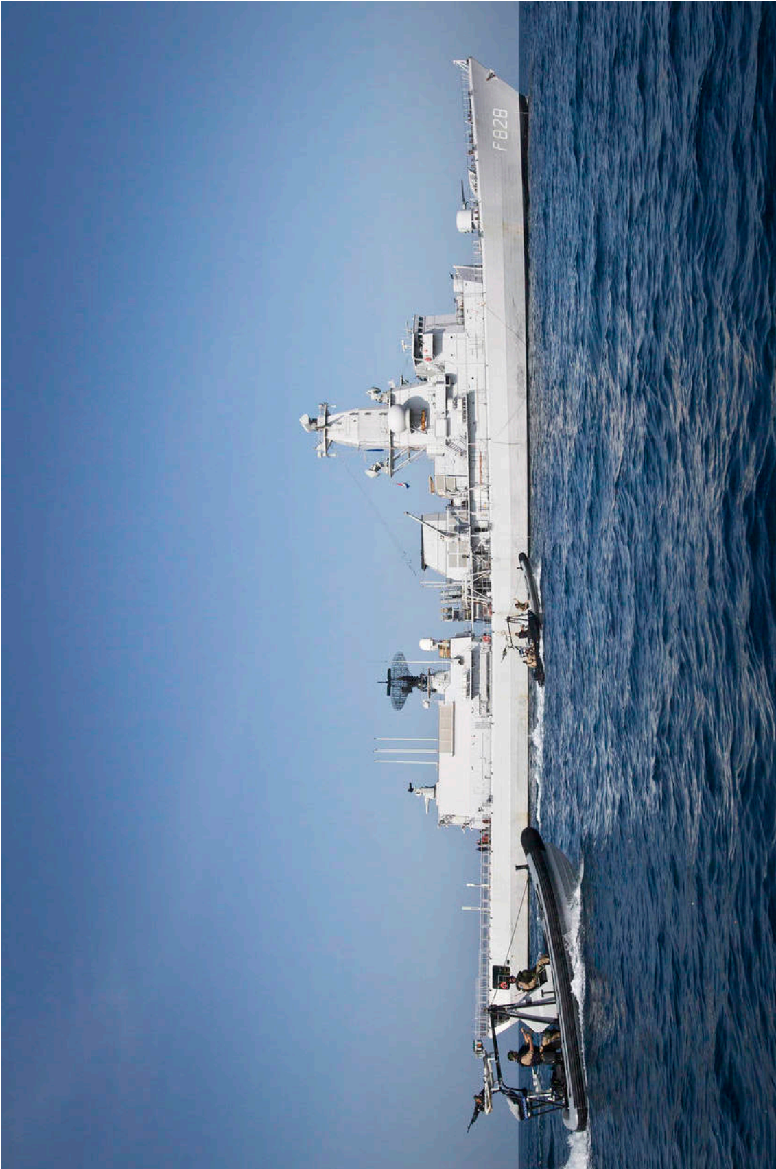
Het M-fregat Zr.Ms. Van Speijk