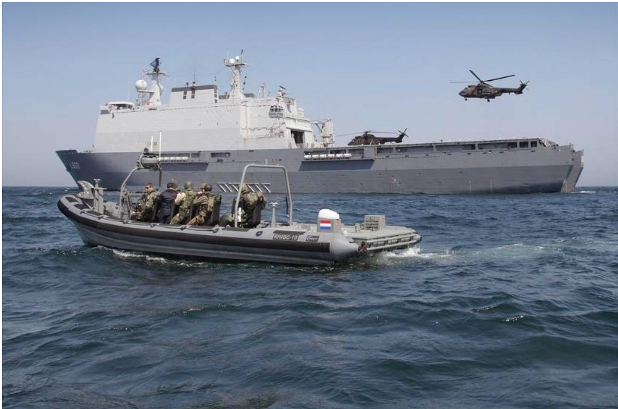
Het amfibisch transportschip Zr.Ms. Rotterdam