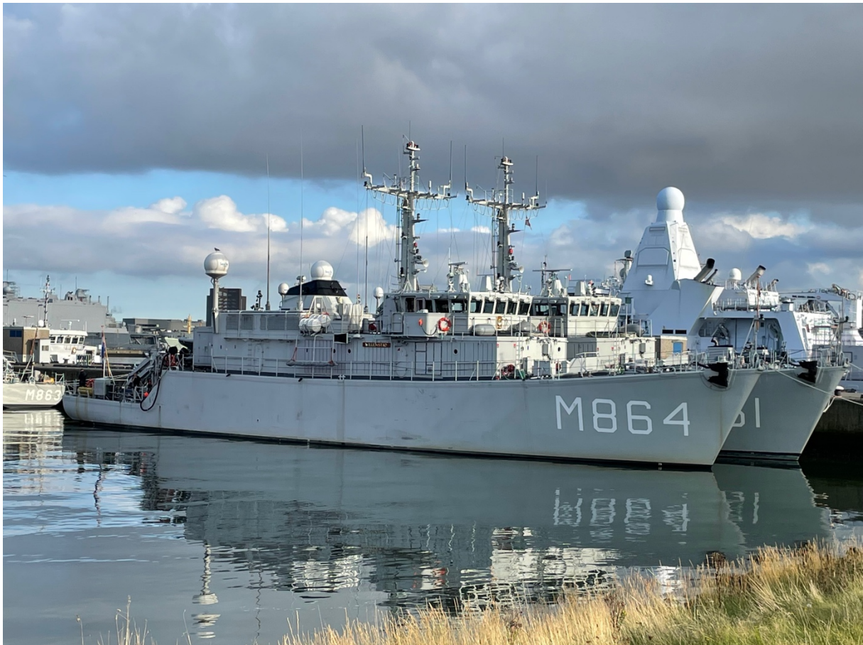
Foto: Zr.Ms. Willemstad en Zr.Ms. Urk te Den Helder